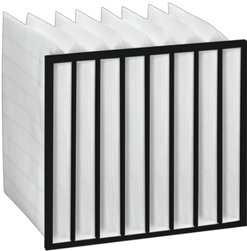
Synthetic filter (melt-blown)